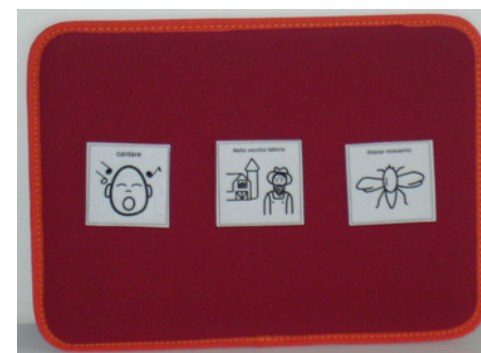
Striscia di attività